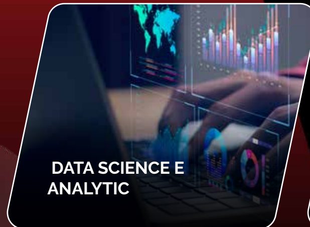
DATA SCIENCE E ANALYTIC