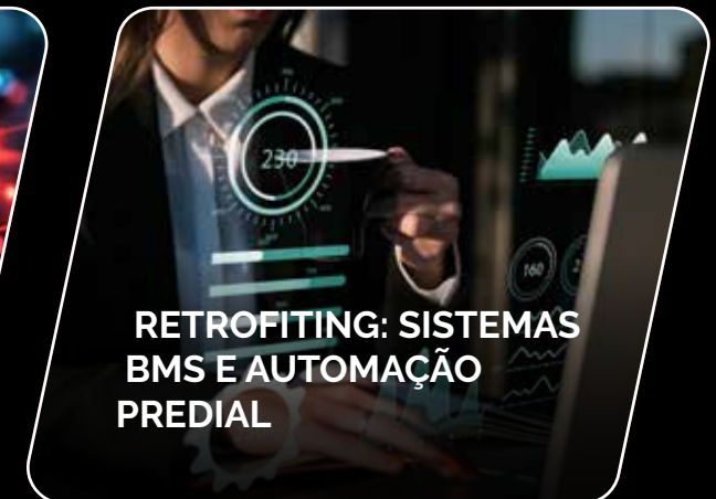
RETROFITING: SISTEMAS BMS E AUTOMAÇÃO PREDIAL