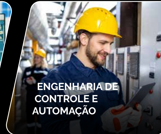
ENGENHARIA DE CONTROLE E AUTOMAÇÃO