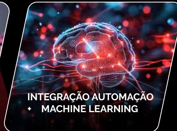
INTEGRAÇÃO AUTOMAÇÃO + MACHINE LEARNING